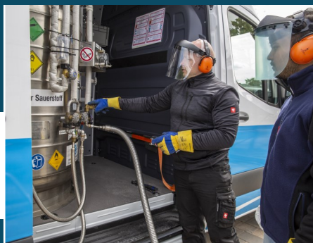
Bild links: Der Fuhrparkleiter befüllt einen der großen Sauerstofftanks, die sich in den Auslieferungsfahrzeugen befinden.