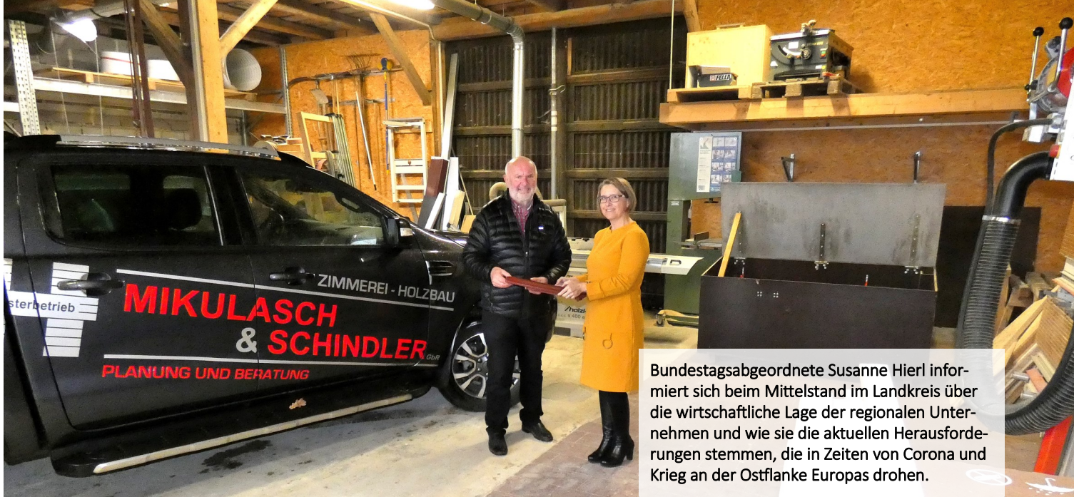
Bundestagsabgeordnete Susanne Hierl informiert sich beim Mittelstand im Landkreis über die wirtschaftliche Lage der regionalen Unternehmen und wie sie die aktuellen Herausforderungen stemmen, die in Zeiten von Corona und Krieg an der Ostflanke Europas drohen.