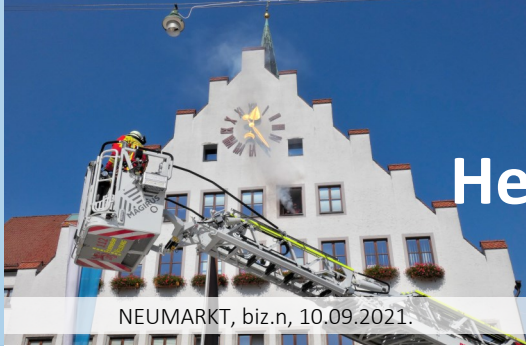
NEUMARKT, biz.n, 10.09.2021.